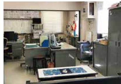
事務室 利用申請、各種問合せ等の窓口です。