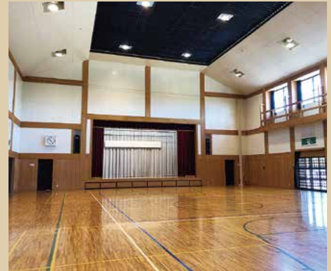
アリーナ バレーボールコート1面、バドミントンコート2面の他、卓球台4台、放送設備等を完備しており、健康づくりなど幅広く利用できます。