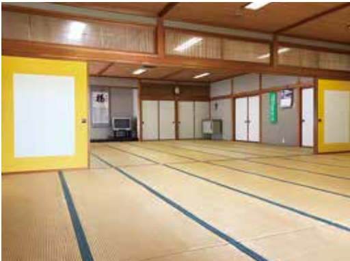
研修室1・2 (和室) 63畳の部屋を2つに区切って使用でき、各種団体の総会、研修会など大人数の集いに最適です。