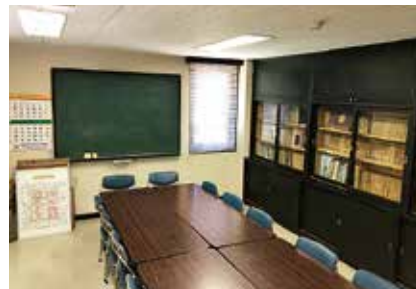
小会議室 少人数の会議や各種団体の会合、情報交換の場として利用できます。