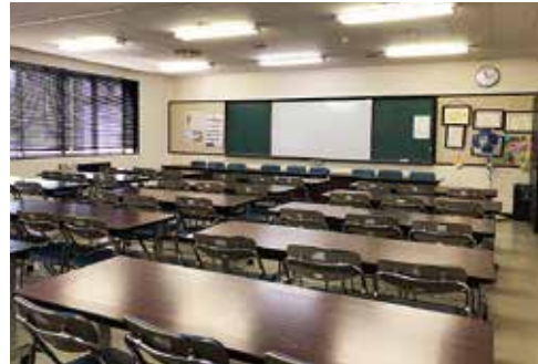
大会議室 30～50人規模の会議や研修会、学習会等に利用できます。

この施設は、研修会・スポーツ・レクリエーション等を通じて地区民の方々の健康づくり・ふれあいの場として利用していただくための拠点施設として設置されたものです。