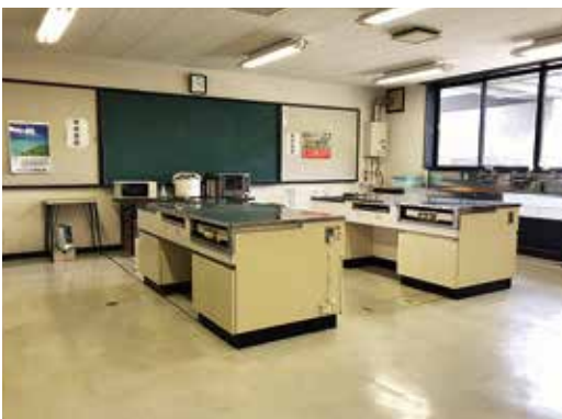
調理実習室 より豊かな食卓を作り出す、お母さんのための実習室です。調理台2台が完備され、30名が利用できます。