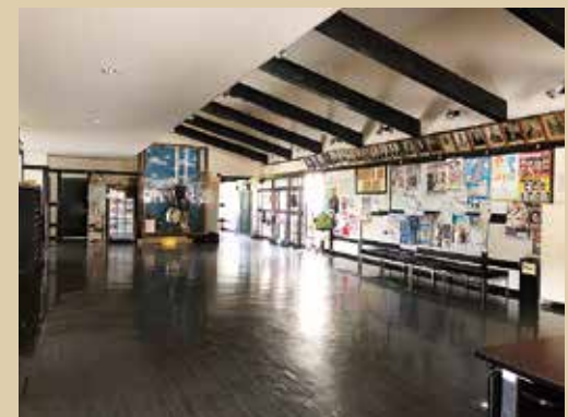
ホール あたたかいふれあいの場として、休息の場、展示コーナーとして利用できます。